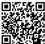
mobilní aplikace V OBRAZE